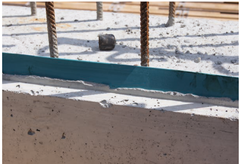
rostband zwischen Bewehrung und Wandschalung in den weichen Beton stecken.