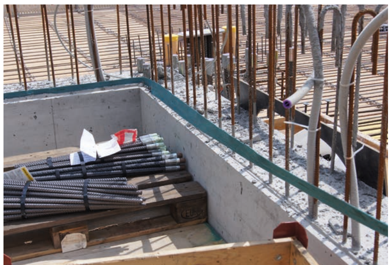
Vor der nächsten Schalungsetappe einfach rauszuziehen.