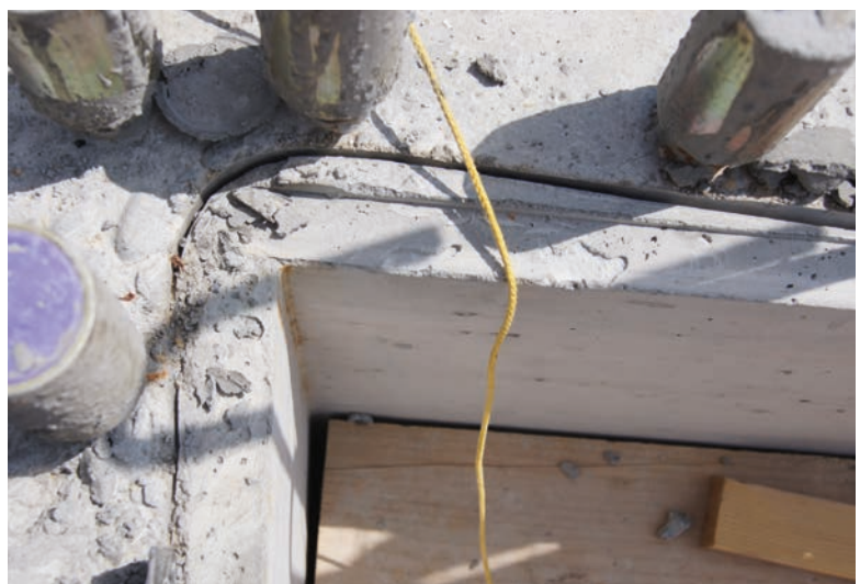
Nach dem Rausziehen hinterlässt rostband eine schmale Fuge, die kurzzeitig als Wasserrinne dient.